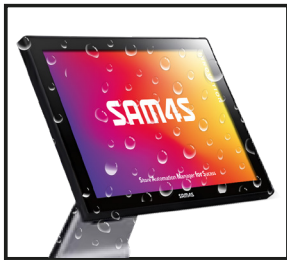
Panel frontal resistente al agua IP55