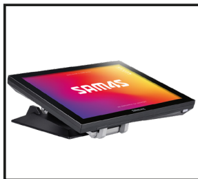
Varios ángulos de operación disponibles