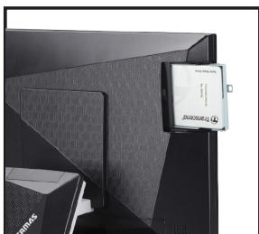
Fácil acceso a SSD

Sapphire ofrece la combinación perfecta de imagen distintiva y servicio al cliente eficiente, lo que la convierte en la opción ideal para empresas que buscan diferenciarse en el mercado de punto de venta.