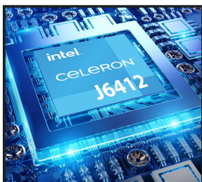
Intel® Celeron® J6412 (Cache de 1,5 M, hasta 2,6 GHz)