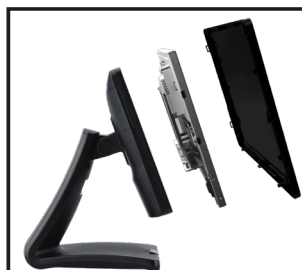
estructura de montaje simple