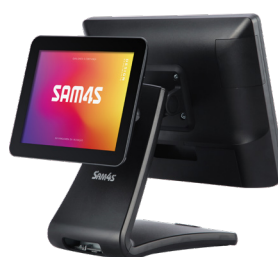
Visor cliente 9.7"