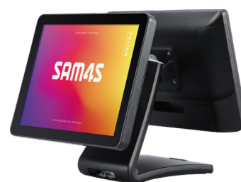
Visor cliente 15"