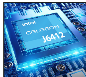
Intel® Celeron® J6412 (Cache de 1,5 M, hasta 2,4 GHz)