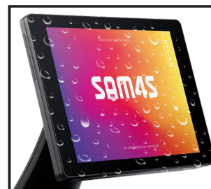
Panel frontal IP55 a prueba de agua

TITAN se renueva en un nuevo modelo aún más innovador y eficiente.