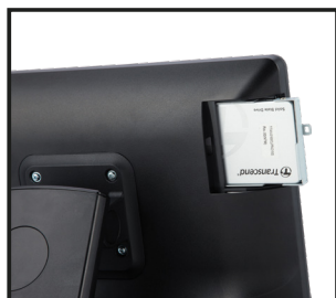
Fácil acceso a SSD