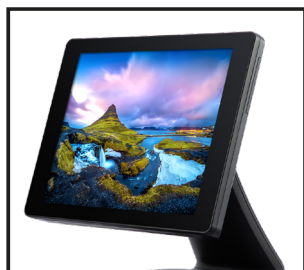
Ecrã LCD-LED de 15" con PCAP Touch